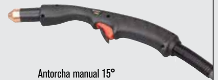
Antorcha manual 15°