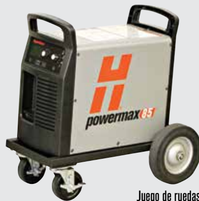
Juego de ruedas