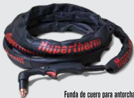
Funda de cuero para antorcha