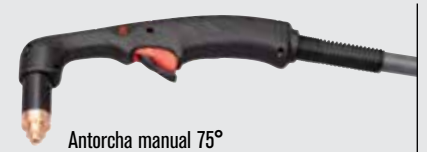
Antorcha manual 75°

(visitar www.hypertherm.com para más opciones de antorchas)