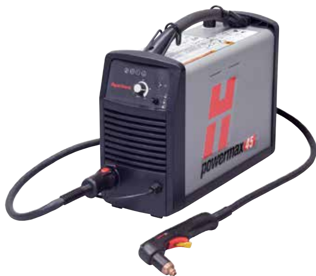
Antorcha manual T45v