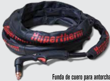
Funda de cuero para antorcha