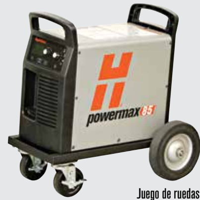
Juego de ruedas