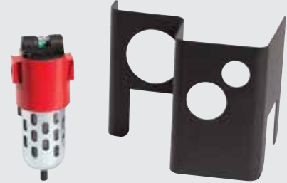
Juego de filtración de aire